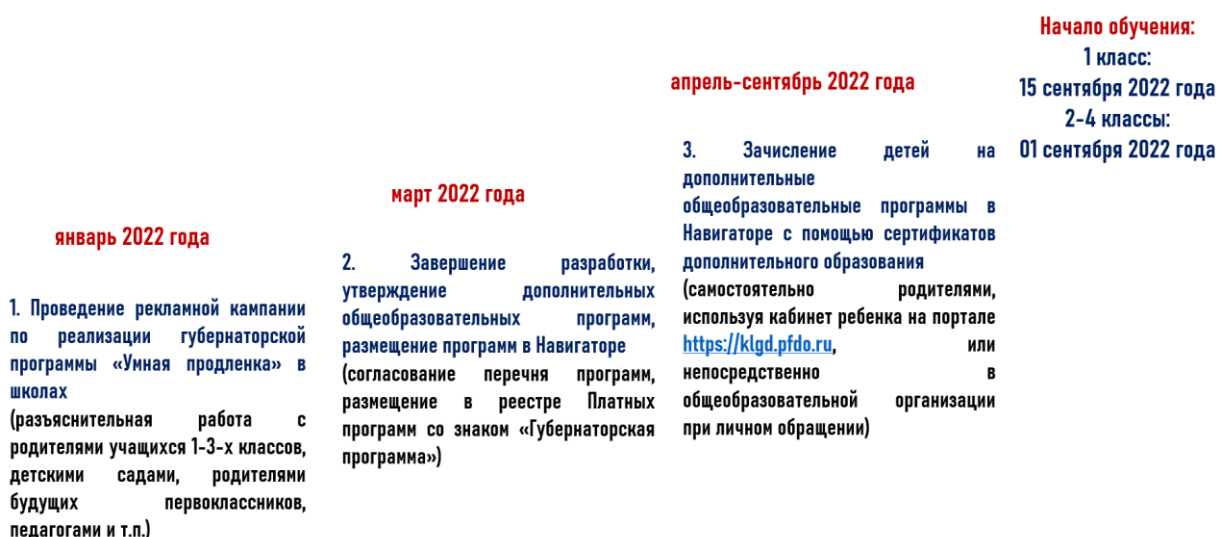
Рисунок. Алгоритм первоочередных действия общеобразовательных организаций по реализации Губернаторской программы «УМная ПРОдленка» Алгоритм действия общеобразовательных организаций

Банк лучших практик программ дополнительного образования технической, художественной, социально-гуманитарной и физкультурно-спортивной направленностей для начальных классов общеобразовательной школы, направленный на систематизацию, обобщение и распространение успешного опыта по дополнительному образованию младших школьников, размещен по адресу https://drive.google.com/drive/folders/1GQdFc09bO5sNEYofHCXI44011wO-rFfQ .