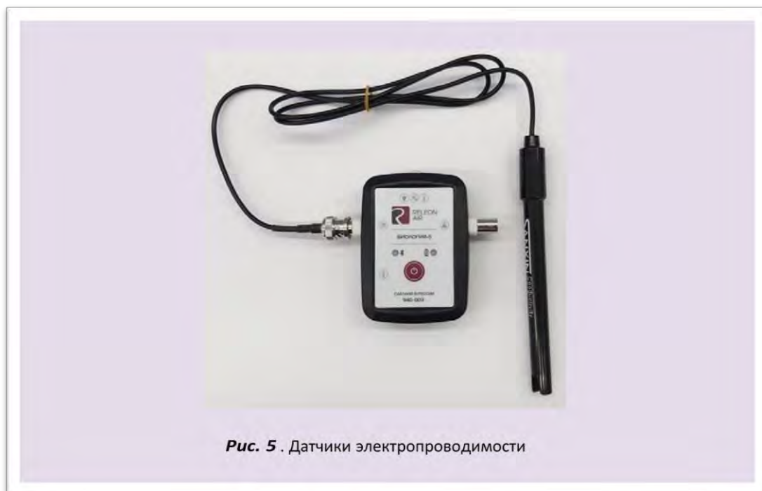
Рис. 5 . Датчики электропроводимости

Датчик освещённости — измеряет уровень освещенности и обладает спектральной чувствительностью близкой к чувствительности человеческого глаза. Диапазон измерения: от 0 до 188 000 лк. Относительная погрешность: 15 %. Диапазон рабочих длин волн: от 350 чувствителен к направлению на источник света.