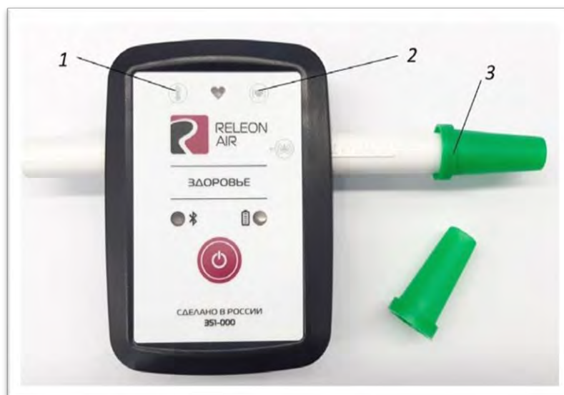
Рис. 3. Мультидатчик по физиологии. Обозначение разъёмов и технологических отверстий: 1 — температура тела, 2 — пульс, 3 — частота дыхания (надет съёмный мундштук)