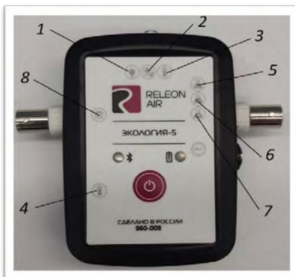
Рис. 2. Мультидатчик по экологии. Обозначение разъёмов и технологических отверстий: 1 — освещённость, 2 — относительная влажность воздуха, 3 — температура окружающей среды, 4 — температура растворов, 5 — нитрат-ионы, 6 — хлорид-ионы, 7 — pH, 8 — электропроводность.

Мультидатчик по экологии позволяет измерять следующие показатели: водородный показатель водных сред, концентрации нитрат-ионов и хлорид-ионов, электропроводность, влажность, освещённость, температуру окружающей среды, температуру растворов, растворов и твёрдых тел (рис. 2).