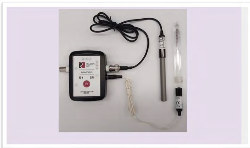
Рис. 10. Ионоселективный датчик

При использовании датчиков нитрат-ионов и хлорид-ионов к специальному разъёму мультидатчика по экологии необходимо подключать ионоселективный электрод (рабочий электрод), а также электрод сравнения (рис. 10).