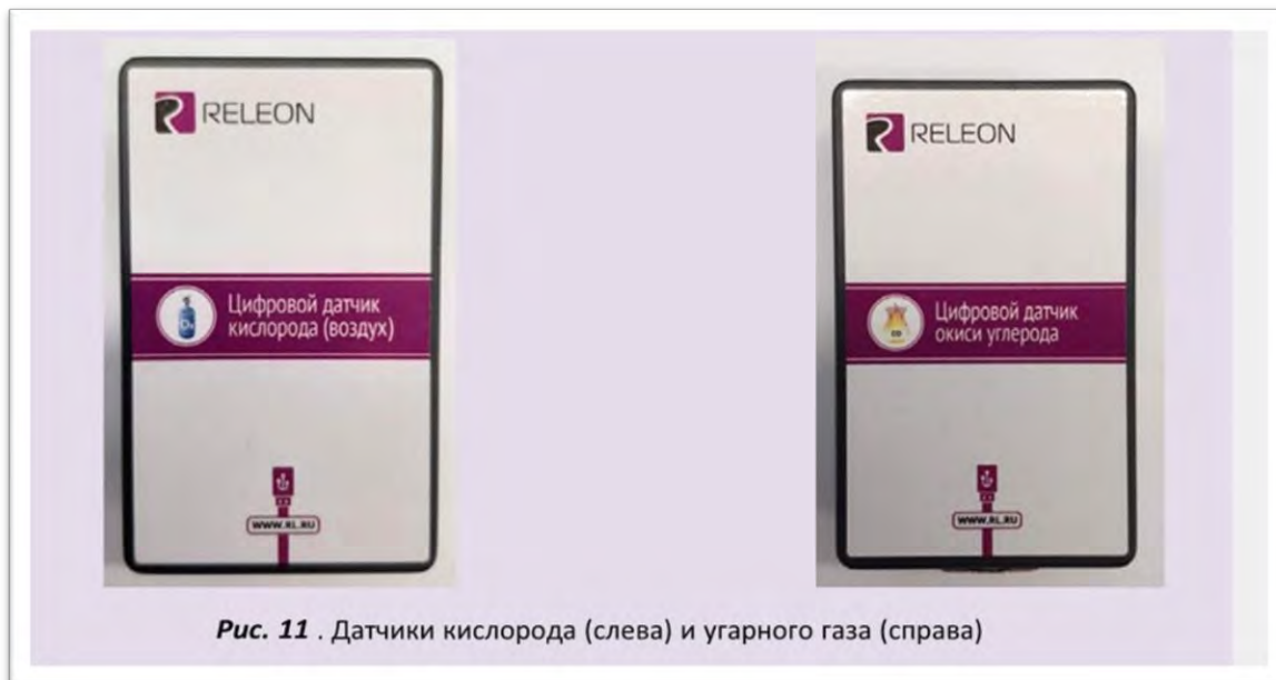
Рис. 11 . Датчики кислорода (слева) и угарного газа (справа)