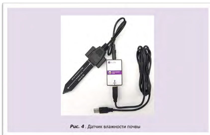
Рис. 4. Датчик влажности почвы

Датчик влажности почвы — предназначен для измерения степени увлажнения почвы, выраженной в процентах. Применяется в агроэкологических и сельскохозяйственных исследованиях.