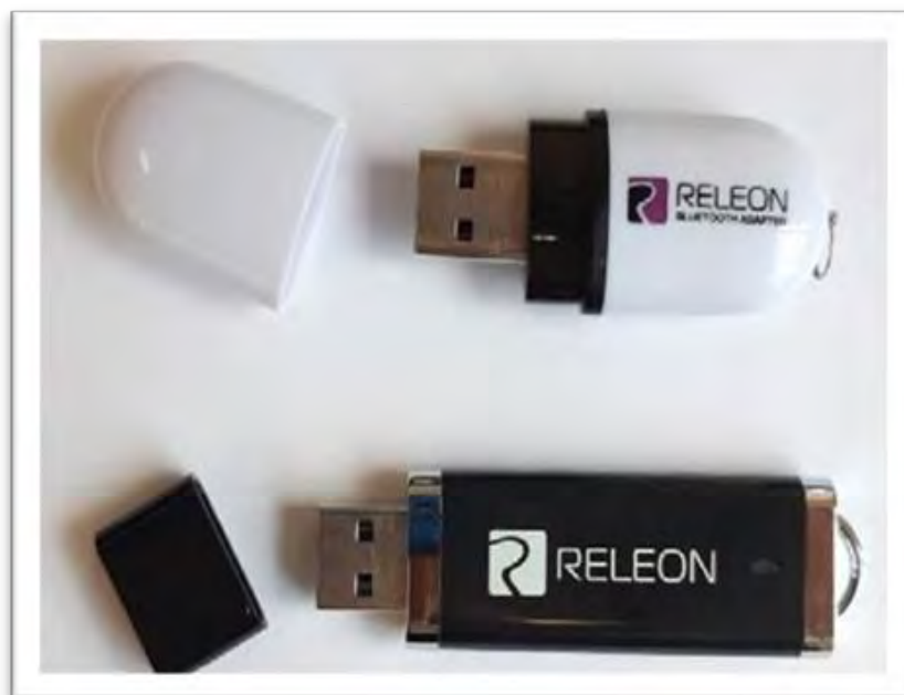
Рис. 13. Общий вид USB -флеш-накопителя (внизу) и Bluetooth -адаптера (вверху) Releon

Lite на регистратор данных с операционной системой Windows может осуществляться как с USB -флеш-накопителя, так и с сайта производителя, установка на мобильные телефоны (смартфоны) — только с сайта производителя, ссылка на который приводится в списке источников информации пособия. В на устройства с платформами Android и iOS . Порядок установки ПО Releon Lite описан в руководстве, которое входит в комплект поставки. Алгоритм работы в программном обеспечении несложен. Графически он представлен на следующей схеме (рис.14)