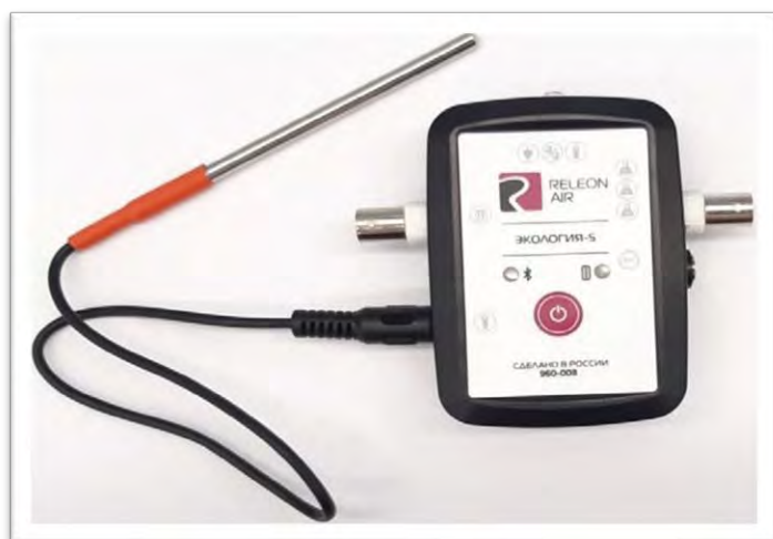
Рис. 6. Датчик температуры растворов

Датчик температуры растворов — измеряет температуру растворов и сыпучих тел. Оснащен выносным и герметичным температурным зондом, устойчивым к лабораторным реагентам (рис. 6). Диапазон измерений от -40 до +180 °С. Технологические особенности: для получения достоверных данных весь зонд должен находиться в измеряемой среде, в противоположном случае возникает значительная погрешность из-за теплопередачи по металлическому зонду и рассеиванию либо поглощению энергии в том месте, где он не находится в измеряемой среде.