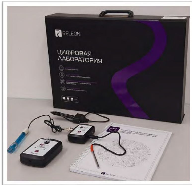
Рис. 1. Цифровая лаборатория

Ниже дана краткая характеристика цифровых датчиков, приведены выявленные на практике технологические особенности применения. Учёт этих особенностей позволит правильно использовать датчики и продлить срок их службы.